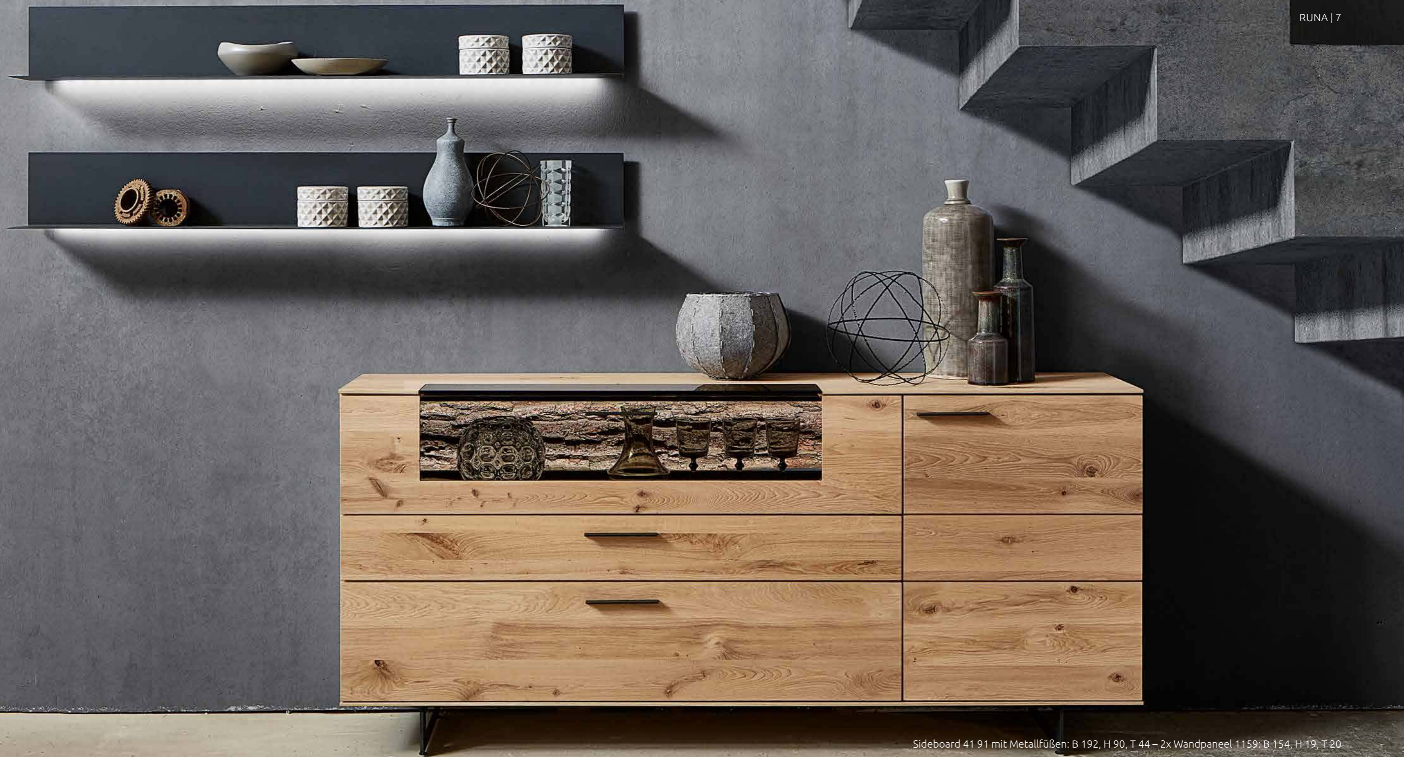
Sideboard 41 91 mit Metallfüßen: B 192, H 90, T 44 – 2x Wandpaneel 1159: B 154, H 19, T 20