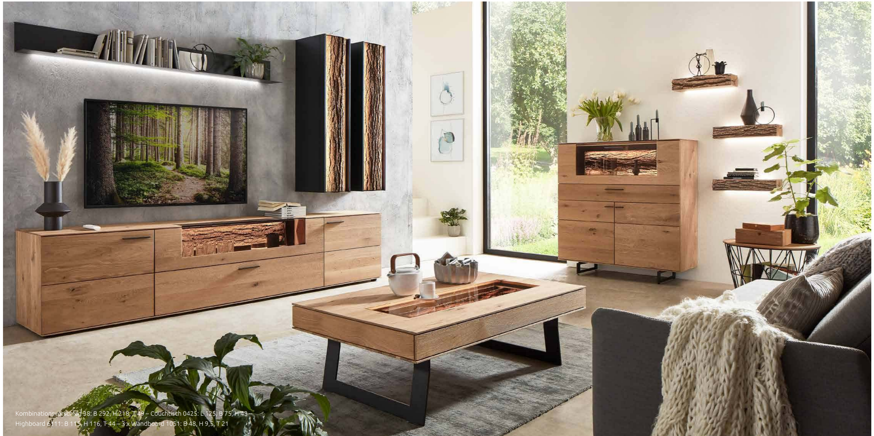
Kombinationsvorschlag 38: B 292, H 218, T 49 – Couchtisch 0425: L 125, B 75, H 43 – Highboard 6111: B 115, H 116, T 44 – 3 x Wandboard 1051: B 48, H 9,5, T 21