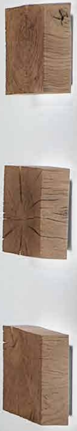
Kombinationsvorschlag Nr. 26: B 346, H 225, T 49/20 – Beistelltisch „Naturstücke“ 1011: Ø 28, H 46 – 3x Wand-Leuchte „Naturstücke“ 1061: B 27, H 27, T 10