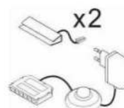
Art.-Nr. AF ZL NW 02