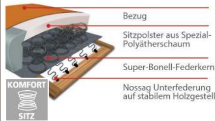
Komfortsitz mit Federkern