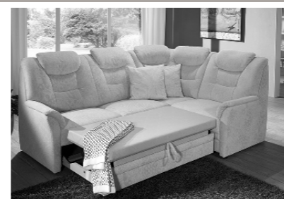
Querschläfer (Mehrpreis, Auszug ist optional im Originalbezug (echt) möglich)