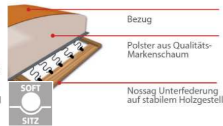
Softsitz mit Markenschaum