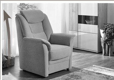
Extra hohe Rückenlehne