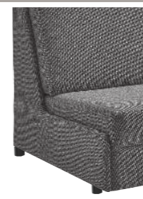
Abschlussblende alternativ zu einem Armteil möglich (Mehrpreis)