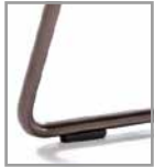
Drahtrohrgestell versch. Metallfarben