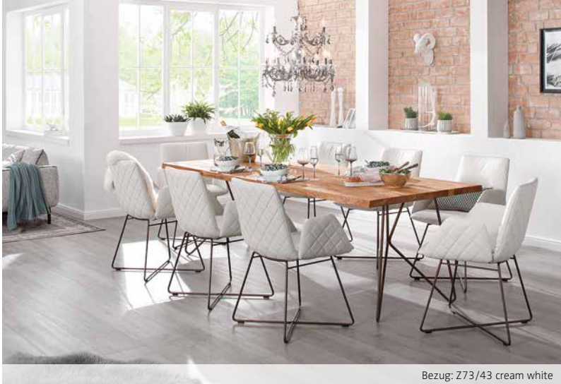
Bezug: Z73/43 cream white