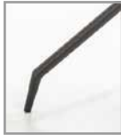
Metall-Kreuzfuß schwarz, Drehfkt./ inkl. Rückholmech.