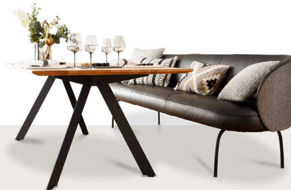
Bezug: Rücken und Seitenteile außen V39/97 black and white; Rücken und Seitenteile innen, Sitzfläche Z73/99 nachtschwarz