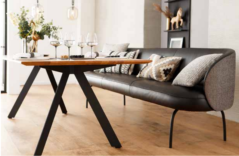
Bezug: Rücken und Seitenteile außen V39/97 black and white; Rücken und Seitenteile innen, Sitzfläche Z73/99