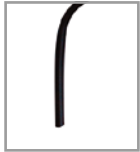
Metallfuß versch. Metallfarben