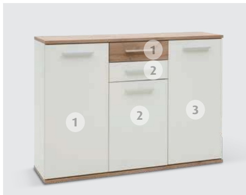
Beispiel 1: Element B 138, H 98,5, T 36,5 cm Seiten und Front in Lichtweiß, Deck- und Sockelplatte sowie 1 Schubkasten in Risseiche Bestelltext: 5612.2019 ColorLine Schubkasten Nr.1 in Risseiche

*Die Oberflächen-Dekore sind furniergetreue Nachbildungen. Innenflächen der Kleiderschränke und Kommoden entsprechen dem Korpus-/Außendekor.