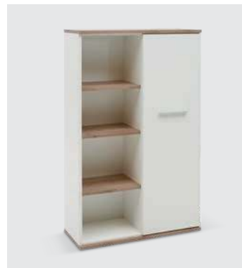
Beispiel 2: Element B 92, H 147,5, T 36,5 cm Seiten und Front in Lichtweiß, Deck- und Sockelplatte sowie 3 sichtbare Einlegeböden in Risseiche Bestelltext: 5474.2019