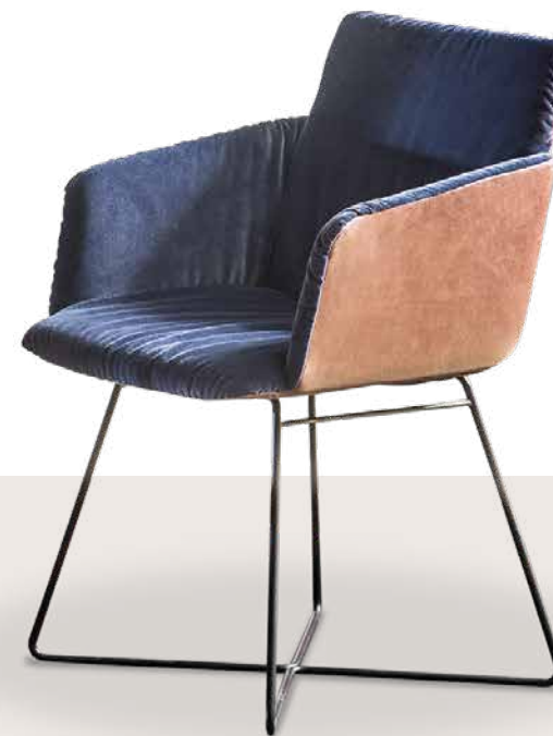
Bezug: außen Z83/54 chocolate, innen V41/29 navy

Dieses Modell ist auch in Kombination verschiedener Bezugsqualitäten und -farben lieferbar.