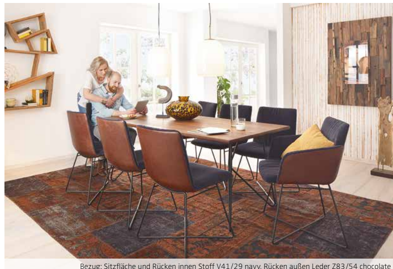
Bezug: Sitzfläche und Rücken innen Stoff V41/29 navy, Rücken außen Leder Z83/54 chocolate