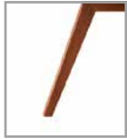
Holzfuß Nussbaum P57 Mehrpreis