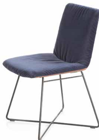
Bezug: Sitzfläche und Rücken innen Stoff V41/29 navy, Rücken außen Leder Z83/54 chocolate