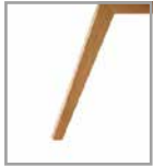
Holzfuß Eiche geölt P58 ohne Mehrpreis