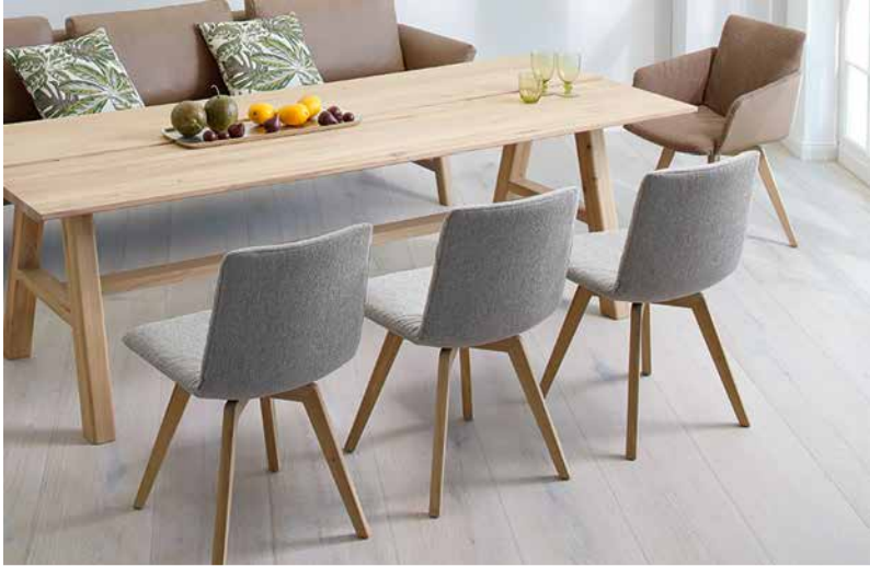
Bezug: MY W77/22, MEY Z73/50 + W78/54; mit Tisch 41125 mika und Bank 11780 cozy