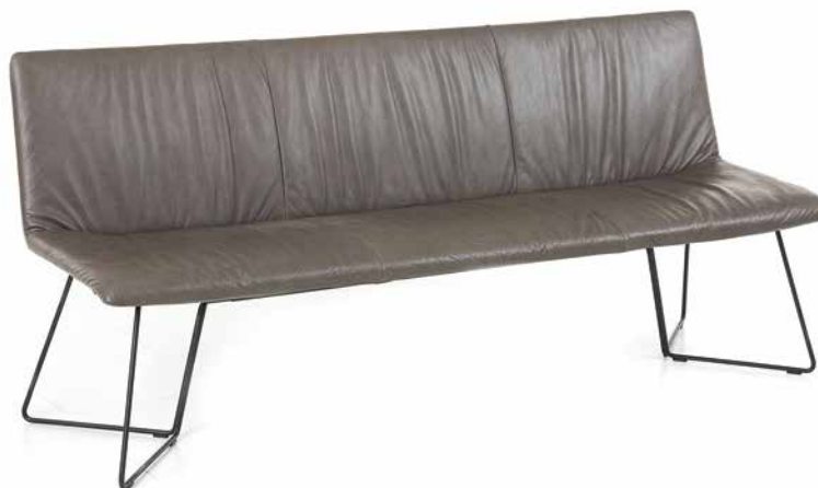
Bezug: Z79/94 graphite