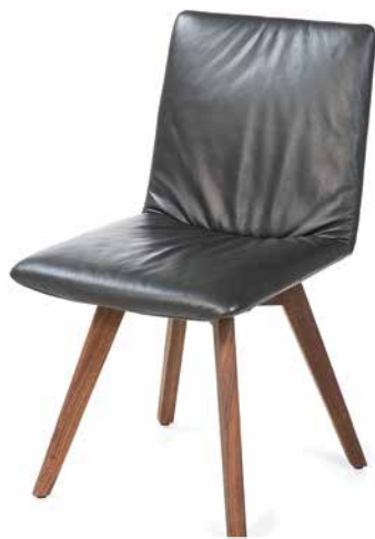
Bezug: Z73/99 nachtschwarz