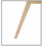
Holzfuß Eiche white wash P60 ohne Mehrpreis