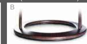
Holzdrehring in Buche (Farbe lt. Beiztonkarte)