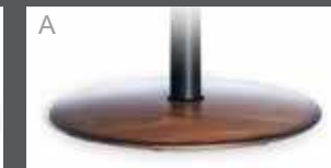
Holzteller in Buche (Farbe lt. Beiztonkarte)