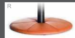
Bezogener Teller (Leder oder Stoff)