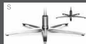
Metall-Sternfuß schmal - verchromt - Edelstahloptik - Anthrazit (pulverbeschichtet)