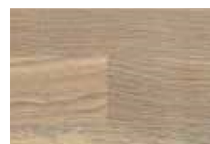
Eiche bianco geölt