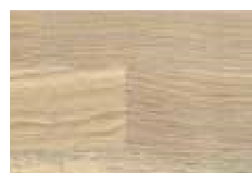
Eiche sonoma lackiert