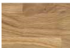
Eiche natur wahlweise lackiert oder geölt