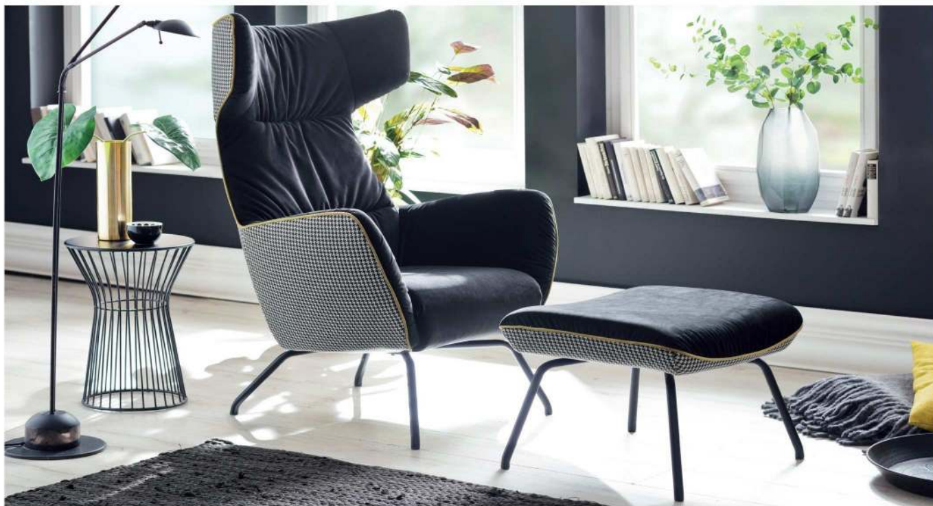
Einzelstuhl + Hocker