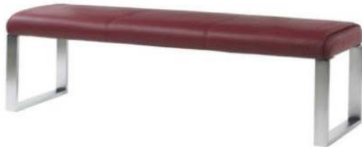
ohne Rückenlehne (kein Zusatz für Artikelnummer)

ACHTUNG: Tresen- und Hochbänke sind nur mit Rückenlehne erhältlich!