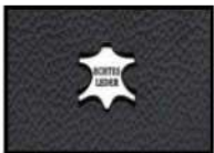
RAVEN II Leder schwarz