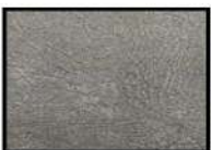
ZINC Microfaser hellgrau