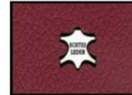
BORDEAUX II Leder rot