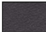
NIGHT Microfaser carbonschwarz