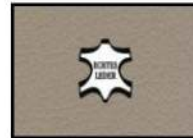
KOALA II Leder taupe