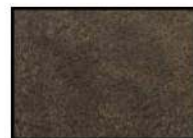
RUST Microfaser braun

Die Artikelnummer setzt sich folgendermaßen zusammen: