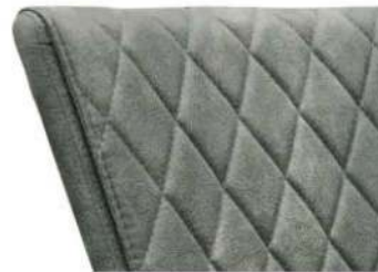
mit Dekor-Rückenlehne „Diamant-Steppung“ (-V an Artikelnummer anhängen)