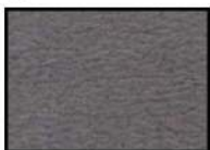
ONYX Microfaser dunkelgrau