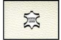
SWAN II Leder weiß