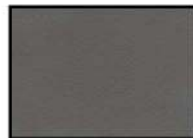
GREY II Kunstleder grau