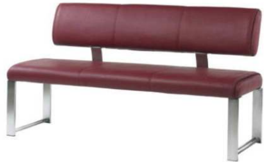
mit Rückenlehne (ohne Muster) (-R an Artikelnummer anhängen)