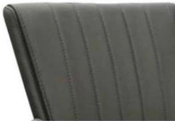
mit Dekor-Rückenlehne „Pfeifen-Steppung“ (-U an Artikelnummer anhängen)