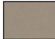
TAUPE II Kunstleder taupe