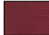
RED II Kunstleder rot