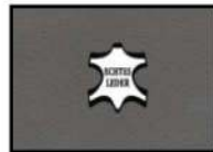
STONE II Leder grau