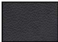
BLACK II Kunstleder schwarz