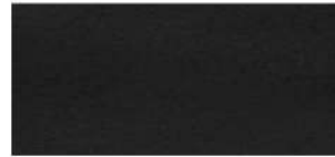
Ausführung schwarz gepulvert