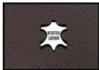
TOFFEE II Leder braun